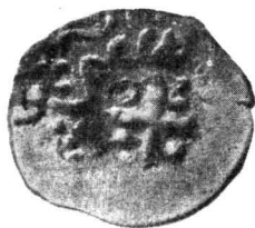
Planche I. — 1, g n vois d'or (tr sor de Br eşti) ; 2, imitation g noise d'un dirhem ou aspre mongol, argent (tr sor d'O teleni) ; 3, follaro de bronze, frapp    Asprokastron-Moncastro sous les princes de Moldavie ; 4, aspres mongols contre-marqu s   Asprokastron-Moncastro, argent (tr sor de C rpi i).