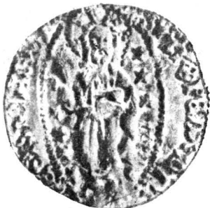
Planche III. — 1, imitation génoise d'or du ducat vénitien de Giovanni Soranzo, or (trésor de Brăești); 2, imitation similaire au nom d'Antonio Venier, or (trésor de Cîrpiți); 3, ducat de Chio, or (même trésor).