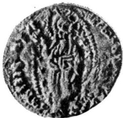
Planche IV. — 1, imitation génoise du ducat d'Antonio Venier, or (Vlădiceni); 2, imitation similaire, or (Borolea); 3, autre ducat de Chio, or, trouvé en Moldavie (Em. Condurachi, Monete veneziane... , figs. 1—2).