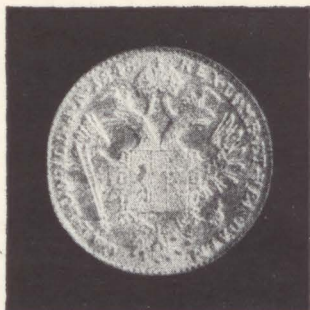
3. Ferdinand I (1835-1848); emisiune din 1848