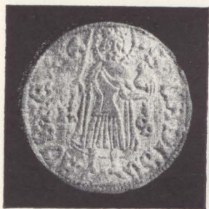
6. Sigismund I (1386–1437)