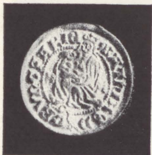
9. Matei Corvin (1458-1490)