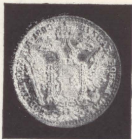
5. Francisc Iosif I (1848–1916); emisiune din 1890