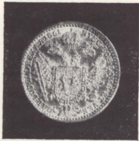
4. Francisc Iosif I (1848-1916); emisiune d'in 1861