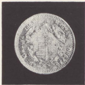
11. Francisc Iosif I (1848–1916); emisiune din 1869