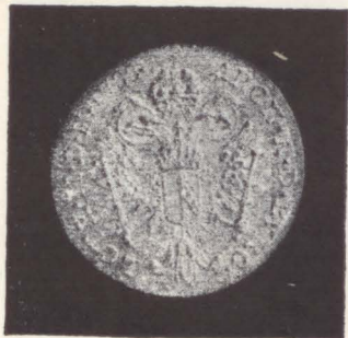
1. Iosif al II-lea (1780-1790); emisiune din 1888