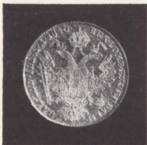
2. Ferdinand I (1835-1848); emisiune din 1840