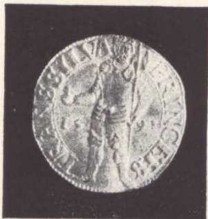
12 Sigismund Bathori (1581–1602); emisiune din 1591