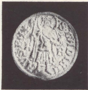
7. Ladislau al V-lea (1453-1457)