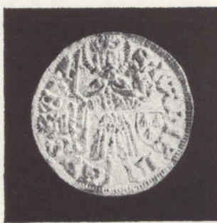
8. Matei Corvin (1458-1490)