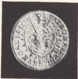
10. Carol al VI-lea (1711-1740); emisiune din 1723